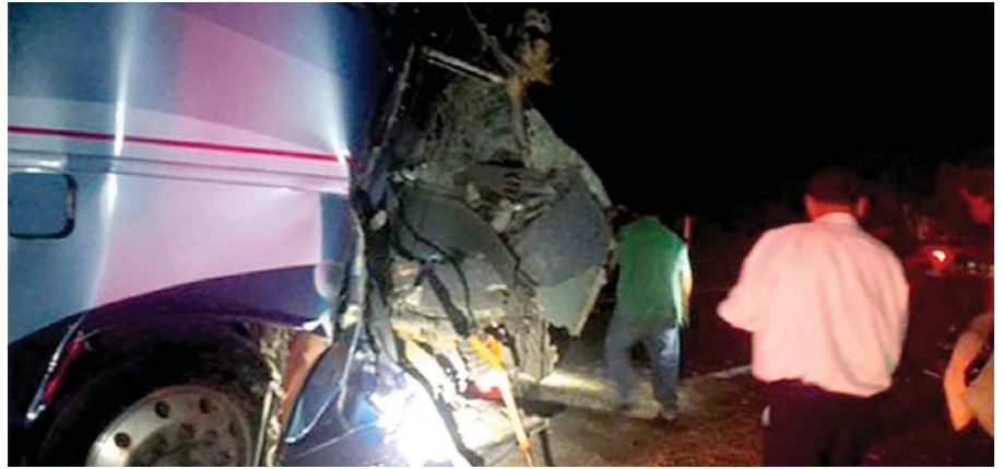
PERCANCE EL TRAMO de las casetas de cobro Miahuapan y El Piñal

Los pasajeros son originarios de Tamaulipas, en